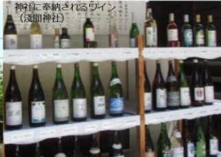
神社に奉納されるワイン（浅間神社）