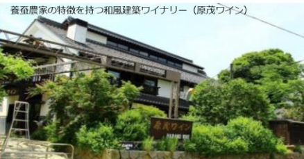
養蚕農家の特徴を持つ和風建築ワイナリー（原茂ワイン）