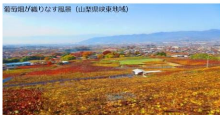
葡萄畑が織りなす風景（山梨県峡東地域）