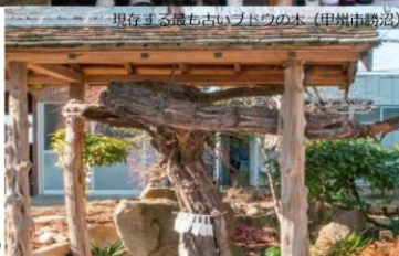
現存する最も古いブドウの木（甲州市勝沼）

平成30年5月に「葡萄畑が織りなす風景～山梨県峡東地域～」が日本遺産に認定されました。山梨市・笛吹市・甲州市の3つの市から成る峡東地域は、現在国内随一の日本ワイン生産地となっていますが、その背景には先人達の知恵と工夫、たゆまぬ努力がありました。そんな日本ワインのルーツを探る旅へ出かけませんか？地元を熟知したガイドが丁寧にご案内します。