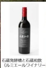
石蔵発酵槽と石蔵和歌（ルミエールワイナリー）