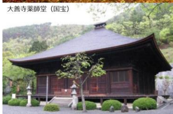
大善寺薬師堂（国宝）